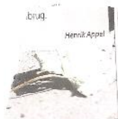
»Hjem med misbrug.

H. Ap- ip ors rpl. som lru- nger at et rue: ge på t, som nmer aldre